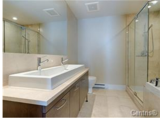
Salle de bains attenante à la CCP