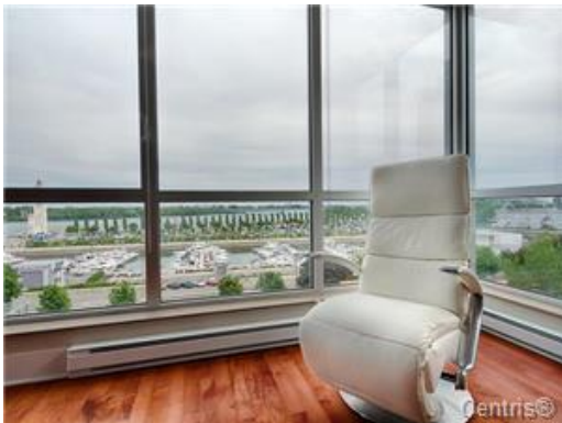
Vue sur l'eau