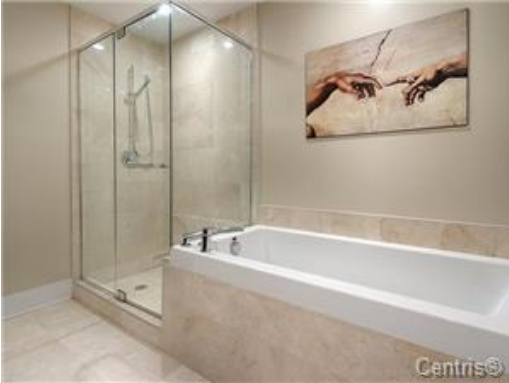
Salle de bains attenante à la CCP