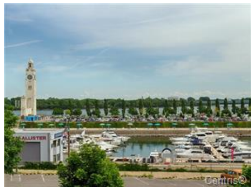
Port de plaisance (marina)